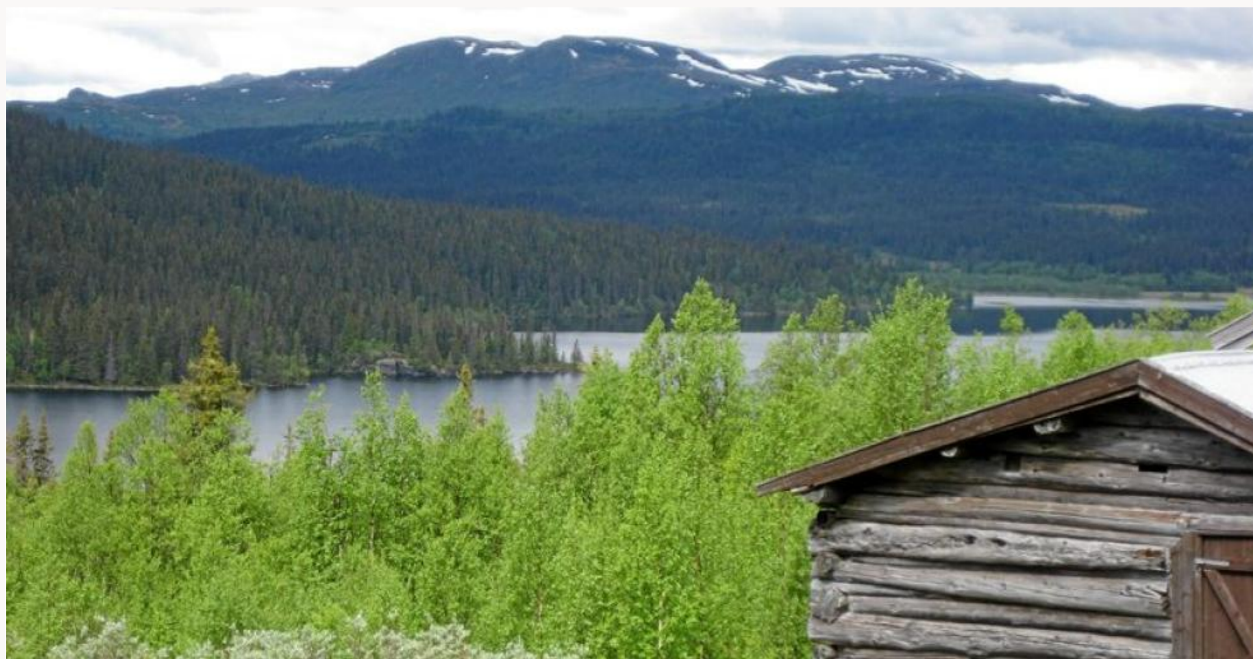
Torpa Statsallmenning, frå Nordre Synnsætra med Synnfjorden i bakgrunnen.

Bør den lokale råderetten over korleis ressursane skal forvaltast styrkjast?